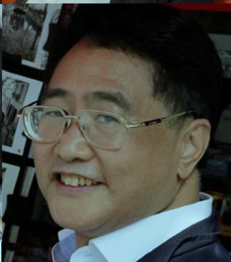
Qiu Xiaolong L'ultimo respiro del drago, Marsilio