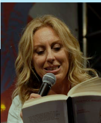
Francesca Fanuele La7