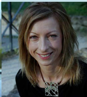
Floriana Bulfon Casamonica. La storia segreta, La violenta ascesa della famiglia criminale che ha invaso Roma, Rizzoli