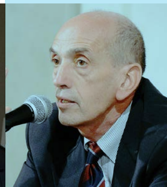
Domenico Quirico La Stampa

Trame. Festival dei libri sulle mafie. Lamezia Terme, 19-23 giugno 2019