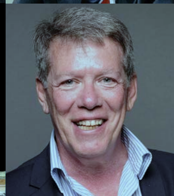
Giocchino Bonsignore Tg5