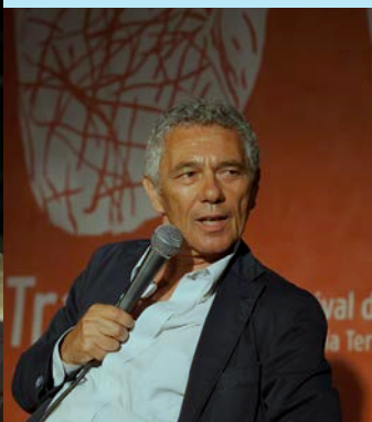
Attilio Bolzoni Il padrino dell'antimafia. Una cronaca italiana sul potere infetto, Zolfo