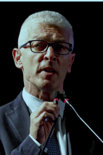
Nicola Morra Presidente Commissione Parlamentare Antimafia