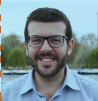
Dario Cirrincione Figli dei Boss. Vite in cerca di verità e riscatto, San Paolo