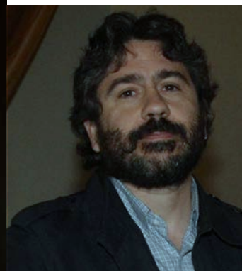
Nello Trocchia, Casamonica. Viaggio nel mondo parallelo del clan che ha conquistato Roma, Utet