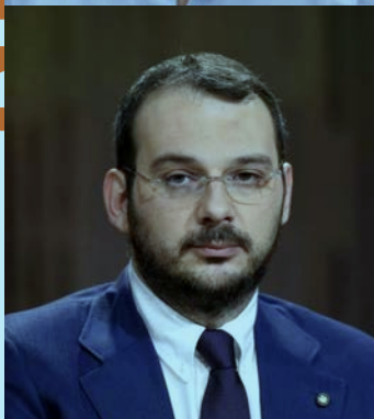
Paolo Borrometi Un morto ogni tanto. La mia battaglia contro la mafia invisibile, Solferino